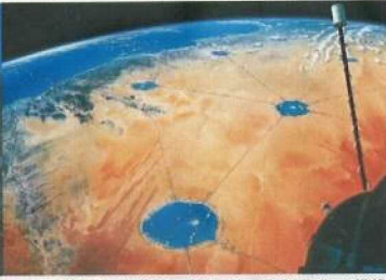
砂漠に巨大な湖をつくるデザート・アクア・ネット構想。