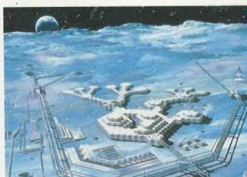
コンクリートでつくる巨大な月面基地構想。

19世紀、まだ飛行機や潜水艦が知られていなかった頃。フランスの小説家ジュール・ヴェルヌは、その作品の中で宇宙旅行や地底探検、海底の冒険を鮮やかに描きだしました。彼の空想は、いま着実に現実のものとなっています。技術の進歩を導きだすのは、人間の豊かな好奇心と想像力なのかも知れません。シミズもまた10年先20年先を睨んで人類のニューフロンティア、宇宙・海洋・地下・砂漠開発の構想に着手。そのためのハードとソフトの研究に、積極的に取り組みはじめました。月面基地や地下数十メートルの大深度地下開発構想。次の世代へと手渡す大いなるロマンを、ひとつひとつ確かなカタチに。シミズはつねに明日を見つめています。