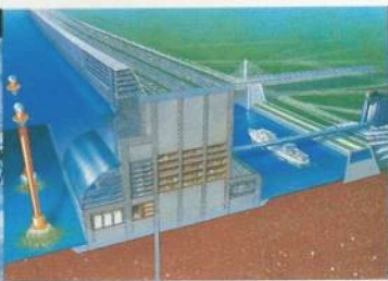
夢の海洋新空間、マリネーション構想。