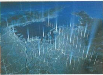
都市の地下利用構想、アーバン・ジオ・グリッド。